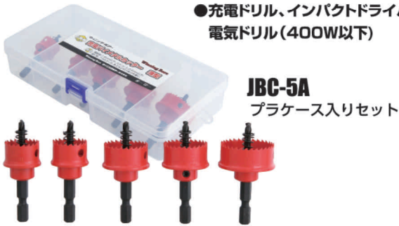
JBC-5A プラケース入りセット