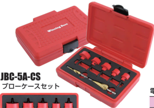
JBC-5A-CS ブローケースセット