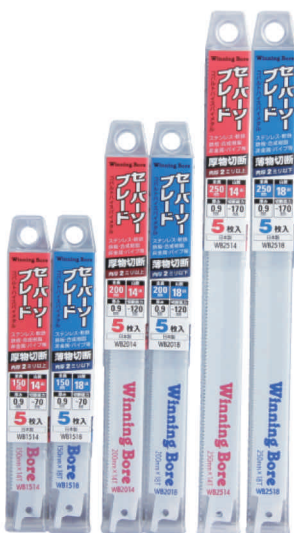
標準タイプ [厚さ0.9mm] (入数5本)