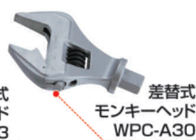
差替式 モンキーヘッド WPC-A30