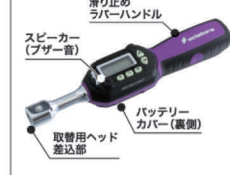
滑り止め ラバーハンドル スピーカー (ブザー音) バッテリー カバー(裏側) 取替用ヘッド 差込部

起動/削除ボタン モード設定ボタン プリセットトルク選択ボタン(MEMORY呼び出しM1~M2...)