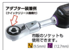
アダプター装着例 (クイックリリース機構付)

この差替式デジタルトルクレンチは、別売品の色々な先端工具に対応できますが、本セット内の差替ギアヘッド(WPC-G19)を使用する際には、ご使用前に工具に刻印されたH2入力設定を行ってください。詳しくは取扱説明書P9~参照してください。