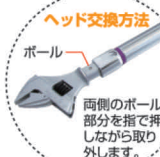
ヘッド交換方法 ボール 両側のボール部分を指で押しながら取り外します。